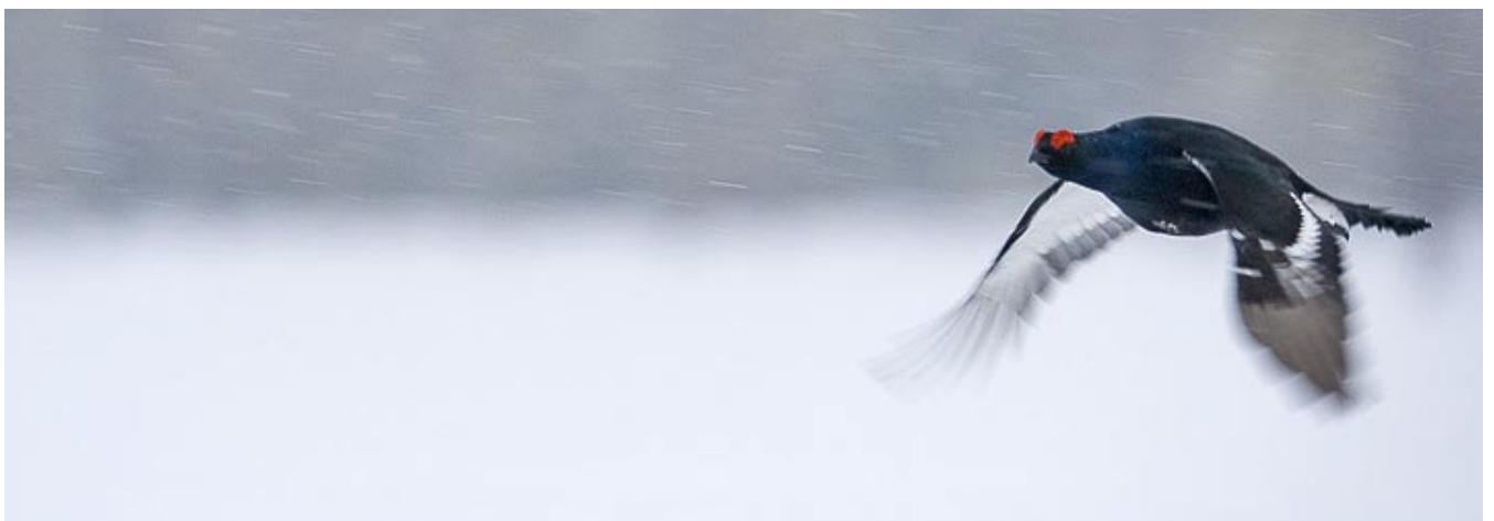
Gall de cua forçada: © Magnus Carlsson - taigavision.com

“Les meves condicions fotogràfiques preferides son quan el temps mostra la seva pitjor cara.”