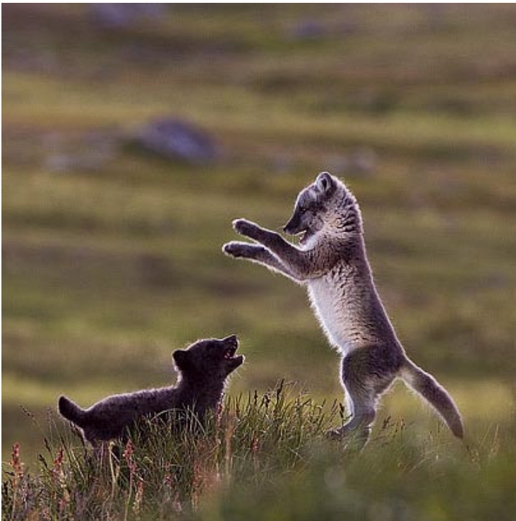
Guineus artiques jugant: © Magnus Carlsson - taigavision.com

“la passió cap a la natura és una necessitat”