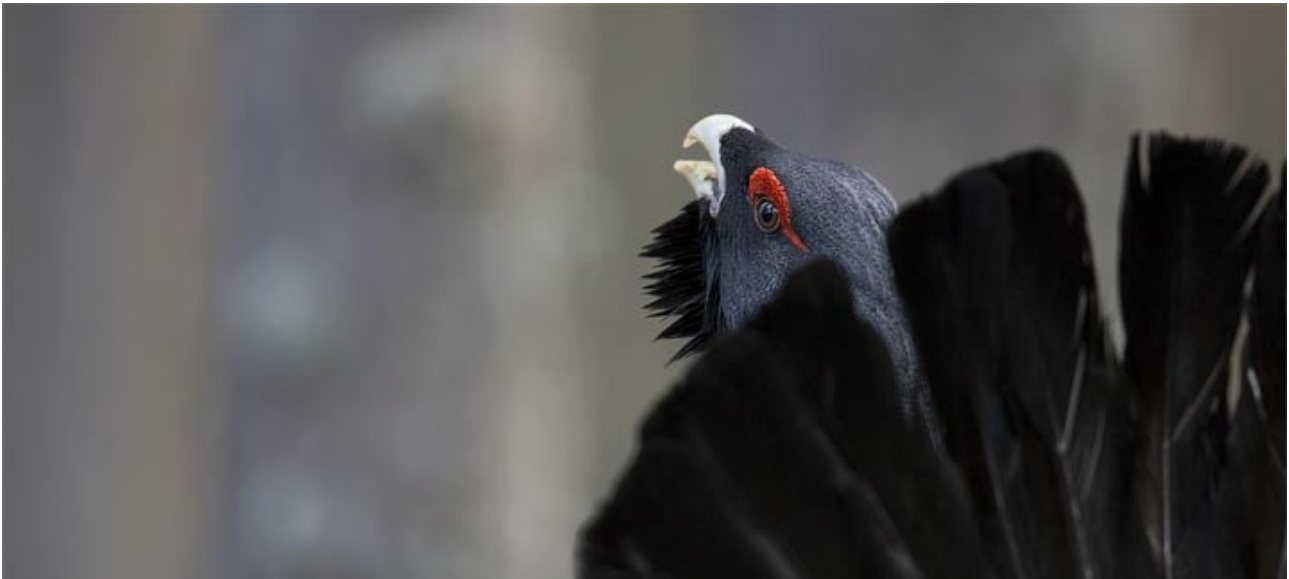
Gall fer: © Magnus Carlsson - taigavision.com

Coneixent cada més a nous fotògrafs, avui viatgem fins al Cercle Polar Àrtic per saber més sobre Magnus Carlsson (Skellefteå, Sweden 1982) fotògraf freelance especialitzat en esports i fauna. Amb exposicions a Espanya, França, Suïssa, i Suècia entre d'altres, en Magnus ens explica la bellesa secreta de la fauna nòrdica.