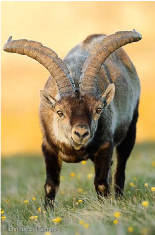
Cabra Montes