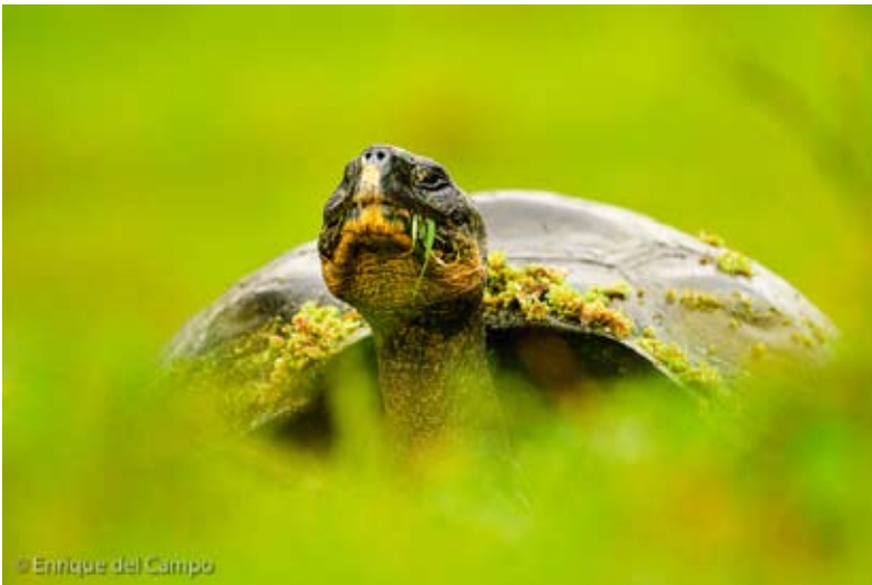
Highly Commended European Wildlife Photographer of the Year 2007

Cuatro años después he tenido el honor de recibir, con la foto conseguida, un Primer Premio en el concurso FotoCAM 2009, en la sección “Hombre y Naturaleza”.